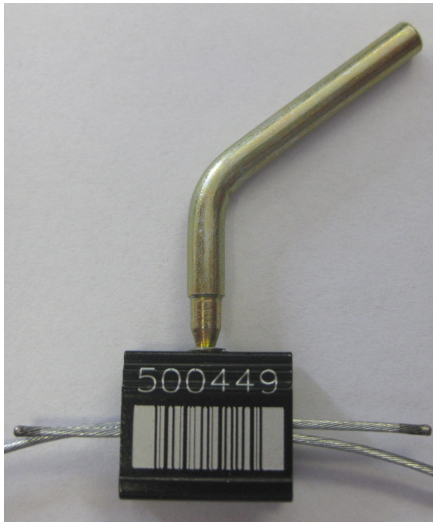
Pohled zepředu 297 041

rádi bychom Vás informovali, že stávající motorové plomby (č. ROTAX 297 040) budou nahrazeny novými plombami (č. ROTAX 297 041) s čárkovým kódem (viz. obrázek níže).