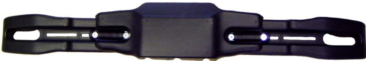
FOTO DEL PARTICOLARE VISTA POSTERIORE